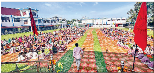
नारायणगढ़। हवनयज्ञ में भाग लेते विद्यार्थी।