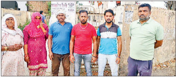
मुलाना। घटनाक्रम की जानकारी देते परिजन।

डुलियाना गांव में गैस सिलेंडर लेने आई महिला से एक व्यक्ति द्वारा छेड़छाड़ी करने का मामला सामने आया है। महिला का कहना है कि आरोपी ने उसे बालों से खींचा और उस के साथ जबरन गलत करने का प्रयास किया। मौके पर मौजूद कुछ लोगों ने उसे उस व्यक्ति के चंगुल से छुड़वाया। पीड़िता का कहना है कि उस के बाद उन्होंने पुलिस की डायल 112 को सूचना दी। पुलिस उस आरोपी व्यक्ति को लेकर थाने आई इसके बाद वह महिला भी अपने परिवार के लोगों व कुछ ग्रामीणों के साथ थाने पहुंची। महिला व उसके