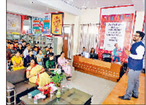
यमुनानगर। गांव सांगीपुर स्थित ग्लोब हेरिटेज इंटरनेशनल स्कूल में आयोजित सेमिनार में विद्यार्थियों को करियर बनाने के बारे में प्रेरित करते मुख्य वक्ता।