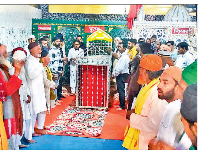
यमुनानगर। सैकड़ों श्रद्धालु डेरा बंदा नवाज में आयोजित उर्स मुबारक में भाग लेते हुए।