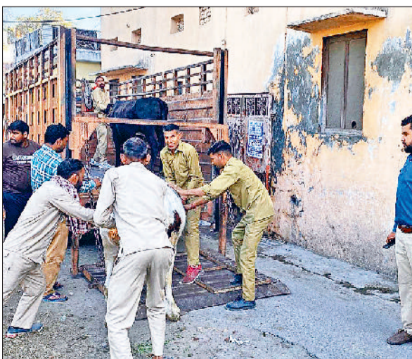
यमुनानगर के पुराना हमीदा में बेसहारा गोवंशजों को पकड़कर वाहन में चढ़ाते निगम कर्मी।

बुधवार को नगर निगम की टीम एसआई सुशील के नेतृत्व में जोन दो के वार्ड नंबर 14 के पुराना हमीदा में पहुंची। टीम ने पुराना हमीदा में विभिन्न स्थानों से आठ बेसहारा गोवंशजों को पकड़ा। निगम कर्मियों ने रस्सियों के माध्यम से घेरा डालकर गोवंशजों को पकड़कर निगम के वाहन में चढ़ाया।