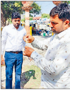
पिहोवा। सैपल लेते स्वास्थ्य विभाग के कर्मी।