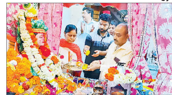
यमुनानगर। ग्रीन पार्क में निकाली गई प्रभात फेरी में बाबा लाल जी आकर्षक झोंकी के दर्शन कर पूजा अर्चना करते श्रद्धालु।

आगे भजन गाती महिला संकीर्तन मंडली की सदस्य चल रही थीं और पीछे श्रद्धालु झूमते हुए प्रभात फेरी की शोभा को चार चांद लगा रहे थे। इस दौरान भजन मंडली की सदस्यों ने जागो जागो जगाने वाले आ गए, आपके घर द्वार पर बाबा लाल जी का दीदार करवाने वाले आ गए, भजन को खूब सारहा गया। इसके अलावा बाबा लाल जी के दरबार से भर लो झोलियां, भर लो झोलियां व बाबा लाल जी के द्वार को सोने सा बनाना है, सेवा में करो अर्पण जो कुछ भी चढ़ाना है.. भजनों पर